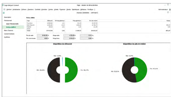
Interface chantier simplifié